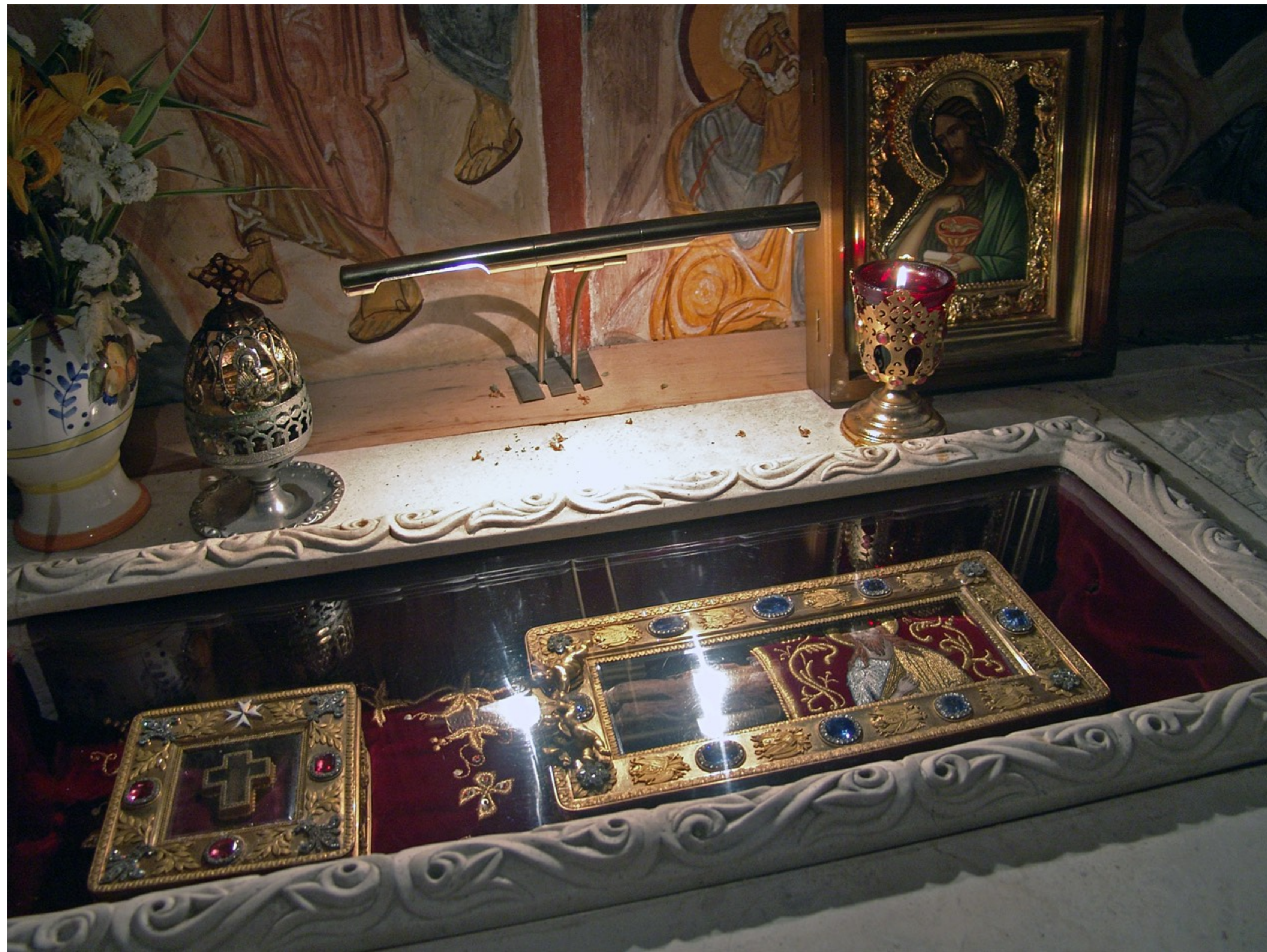
Kloster Cetinje, Reliquenschrein des Hlg. Petar I von Cetinje mit einer Hand Johannes' des Täufer ...