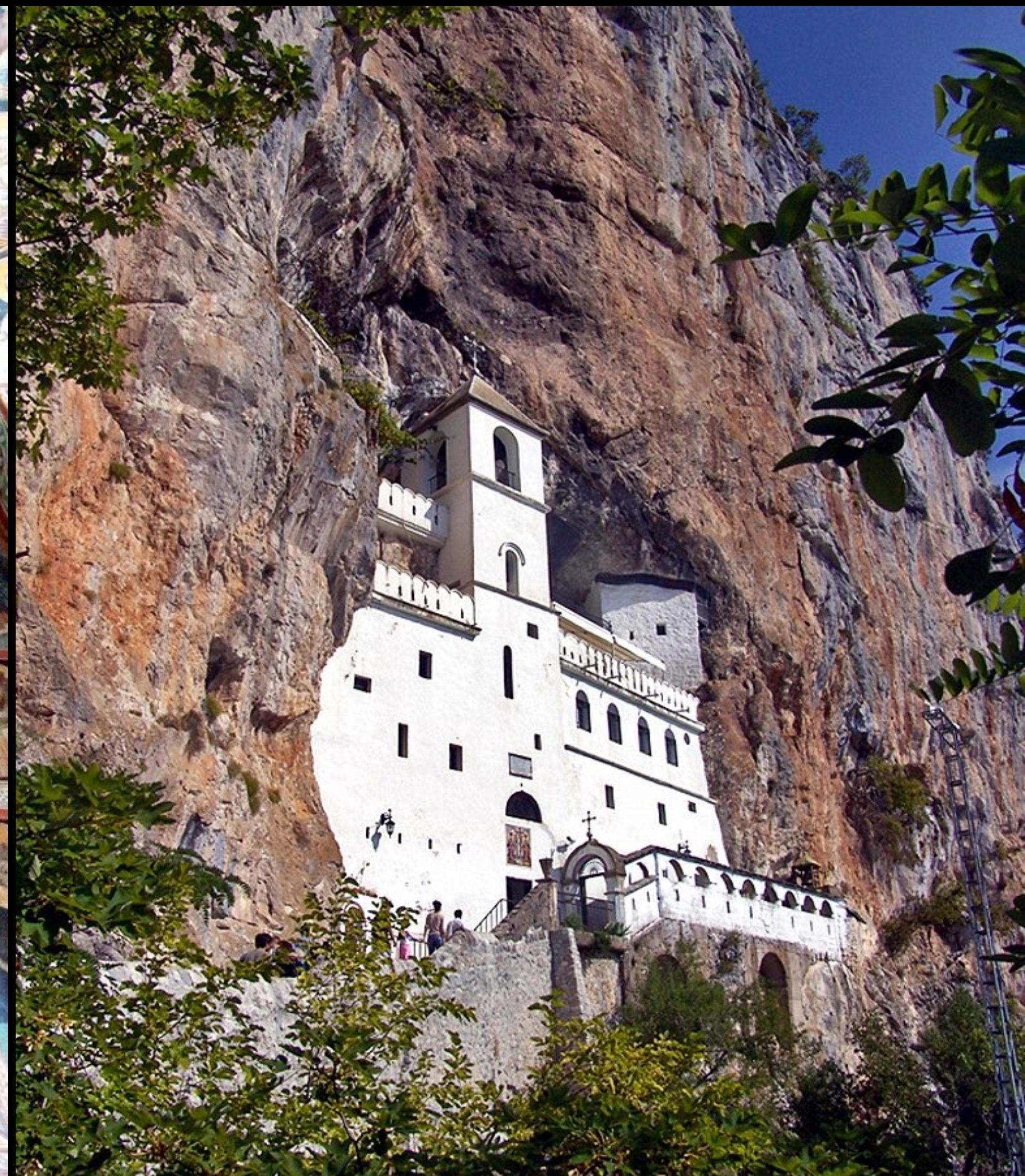
Kloster Ostrog, 17. Jh., Fluchtburg für den letzten König Jugoslawiens und den Staatsschatz im Zweiten Weltkrieg