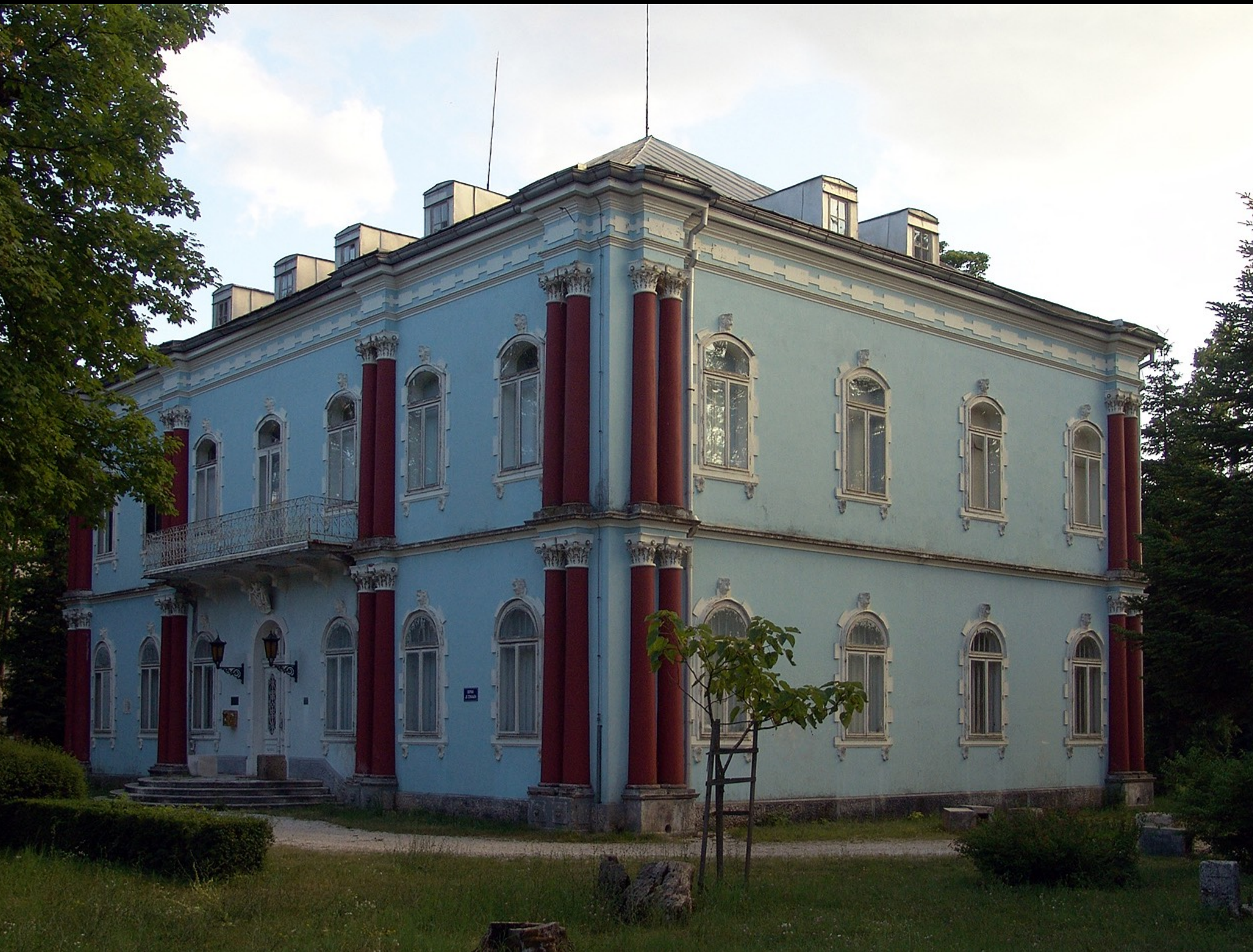
Plavi Dvorac, Blaues Schloss von Cetinje (Ende 19. Jh., stil-bildend), Sitz des Kronprinzen Danilo von Montenegro (1871-1939)