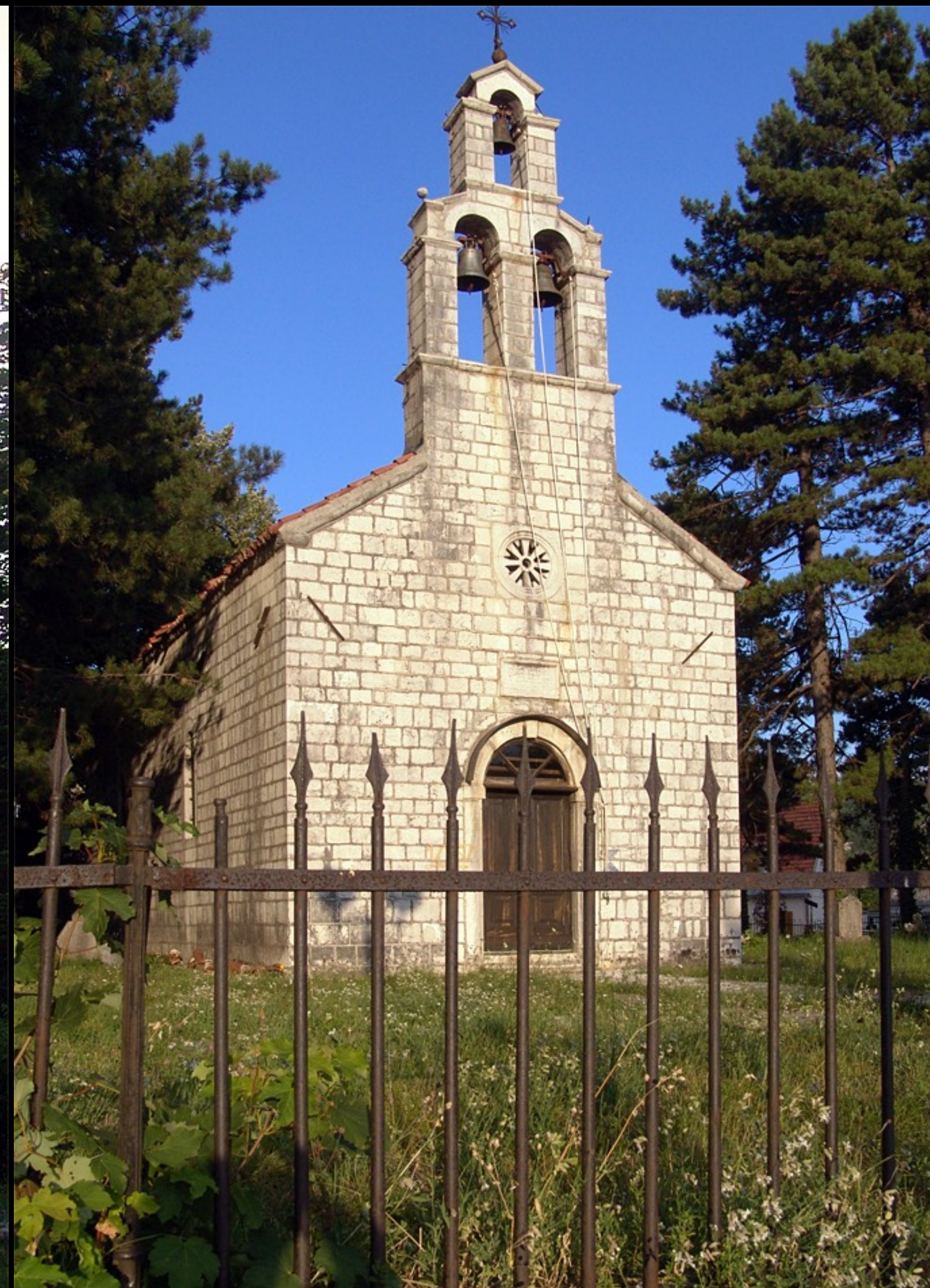
Vlaška crkva, Walachen-Kirche, 1450, osmanische Gewehrläufe als Zaun