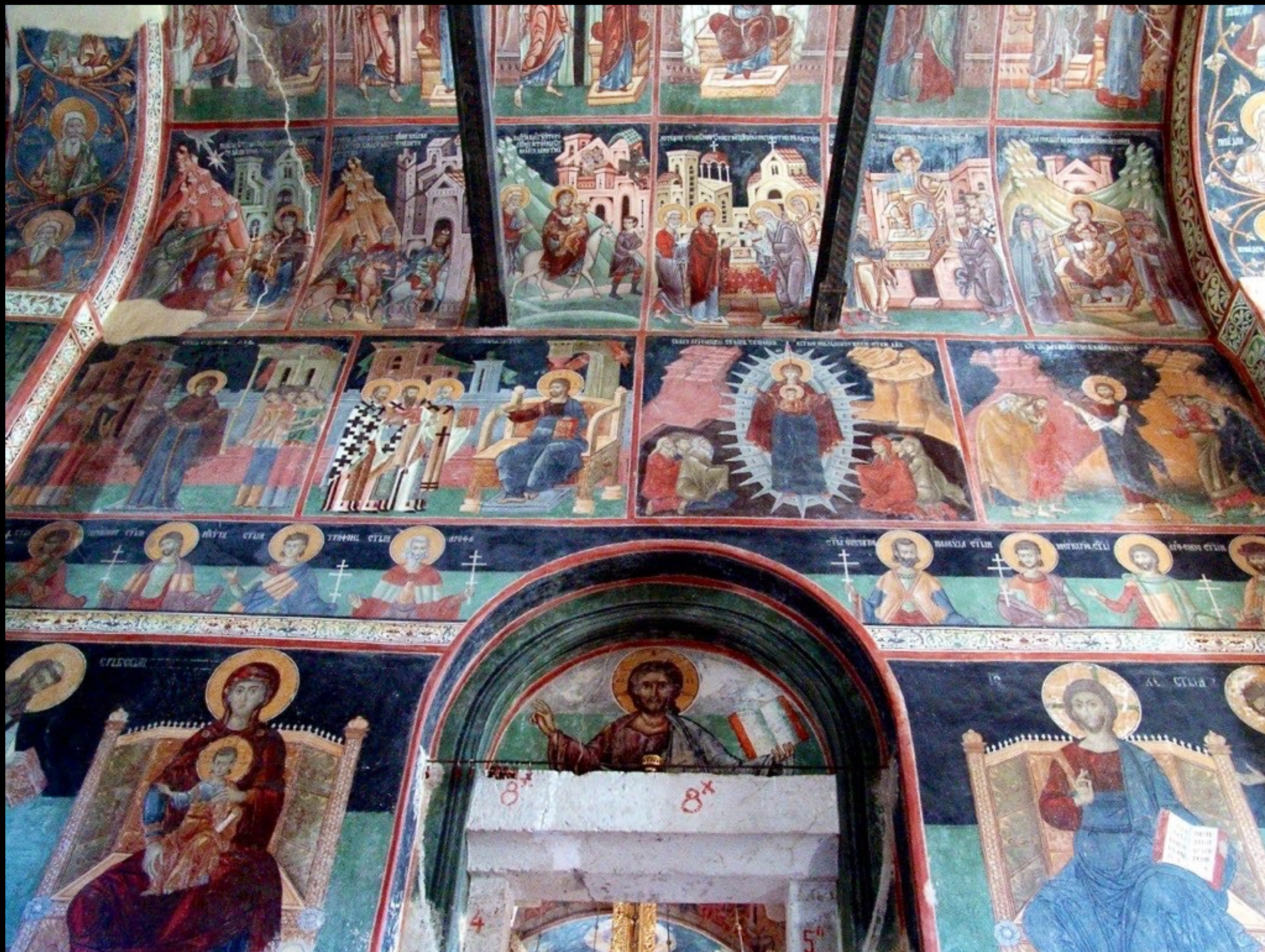
Kloster Piva / Pivski Manastir, 17. Jh., wegen eines Stausee-Projekts „umgesiedelt“