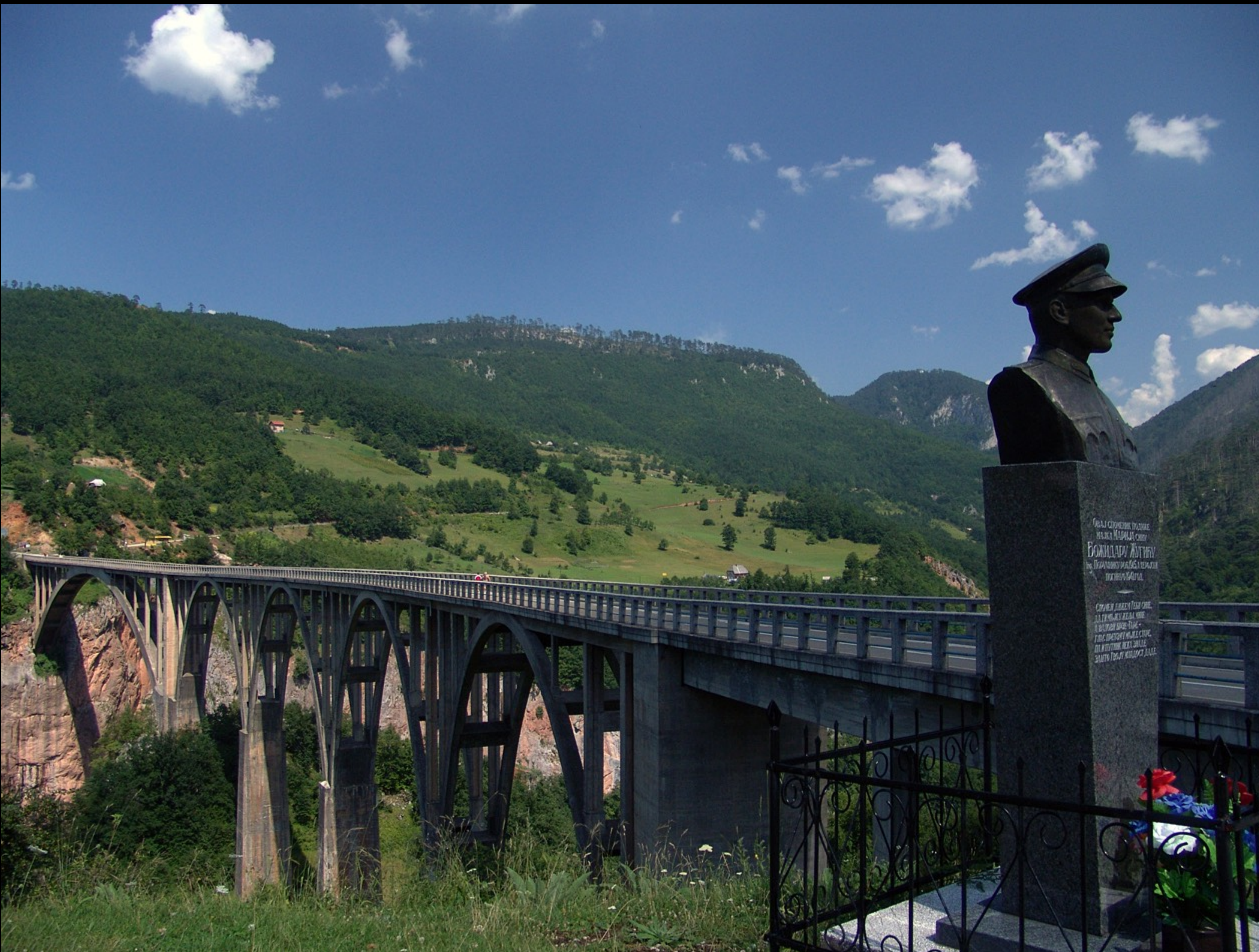
Djurdjevica Brücke, 365m, 170m über der Tara (1937-1940; im Krieg gesprengt, 1946 restauriert)