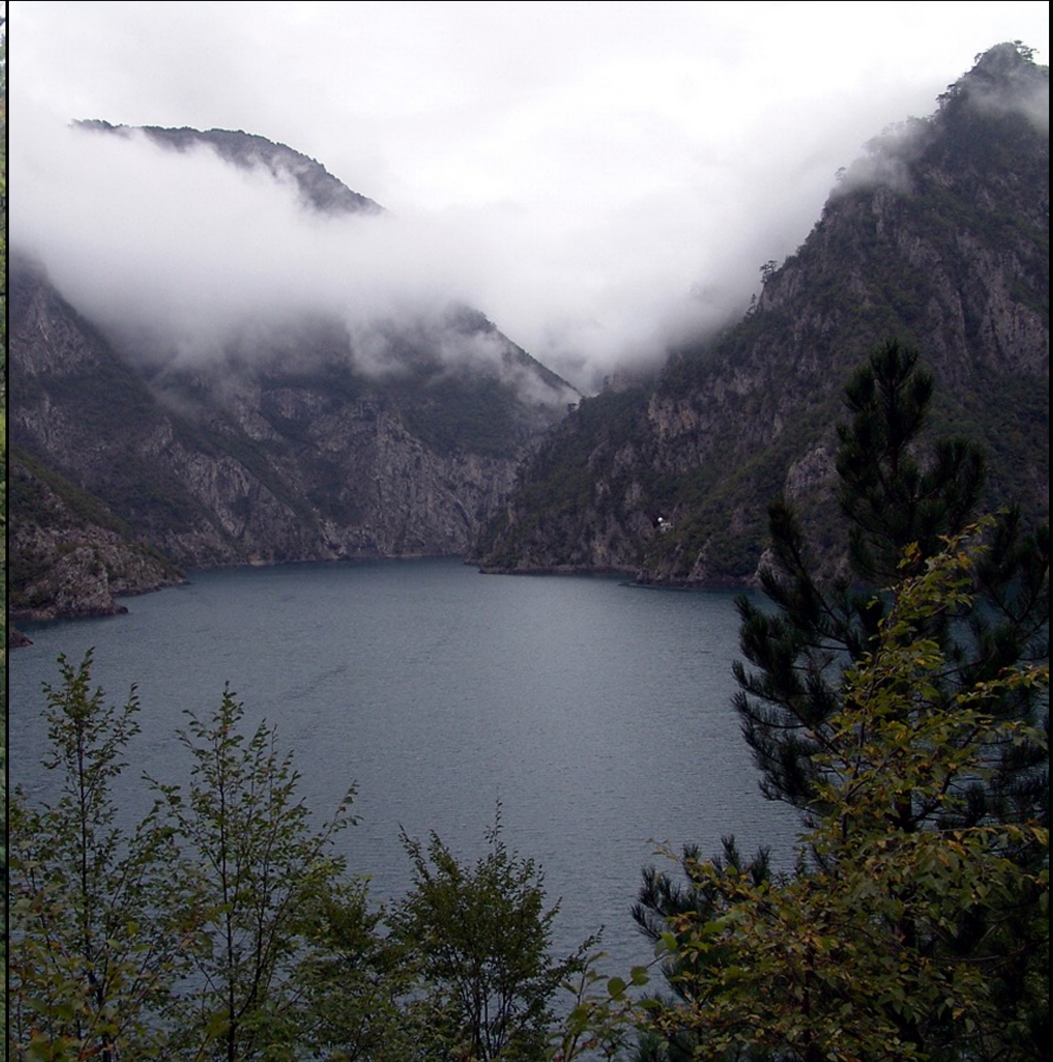
vor dem Mratinje-Stausee