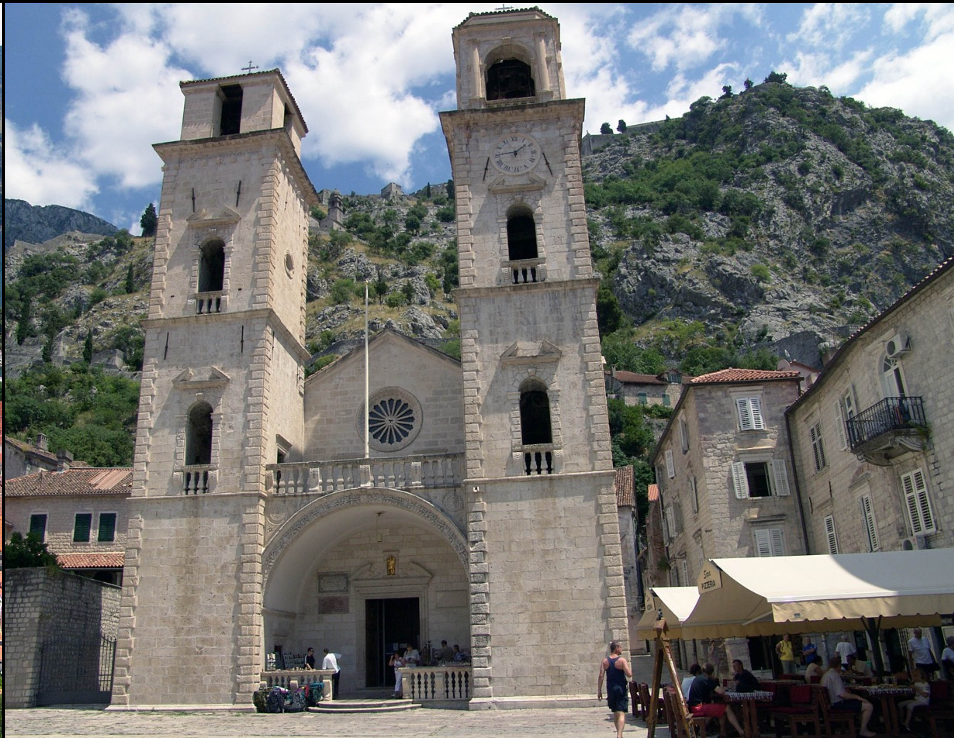
Sankt-Tryphon-Kathedrale Kotor (romanisch, 1124-1166)