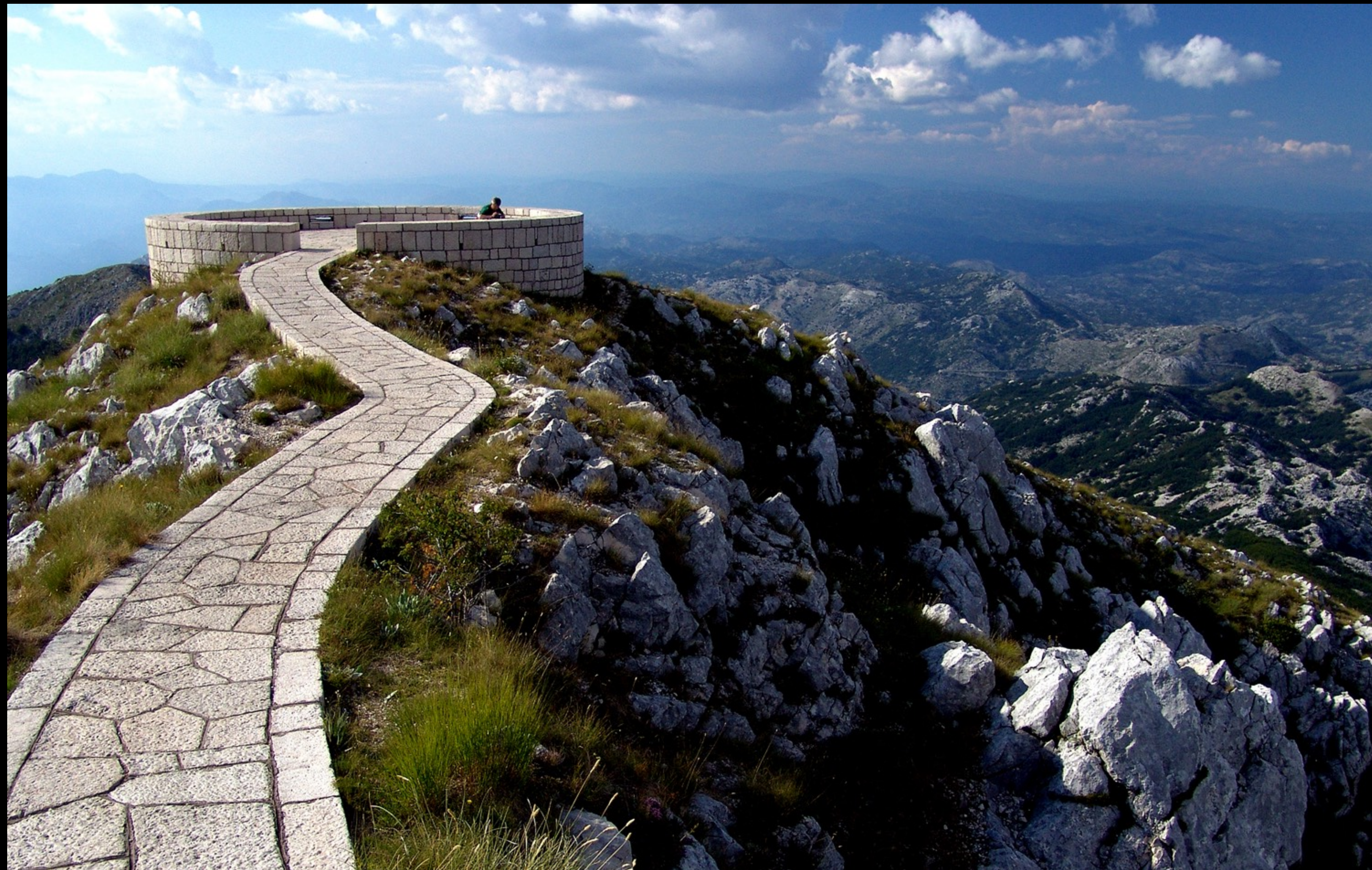
Jezerski Vrh, Blick gegen Westen