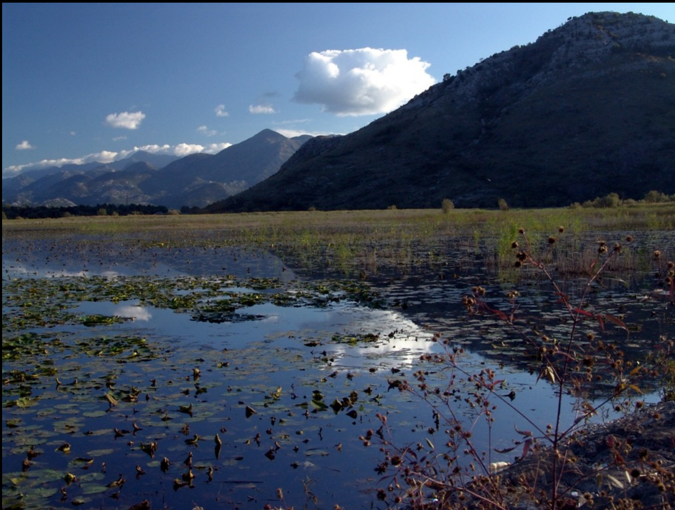
Montenegro teilt den grössten See der Balkan-Halbinsel mit Albanien: Scutari-See / Shkodër-See