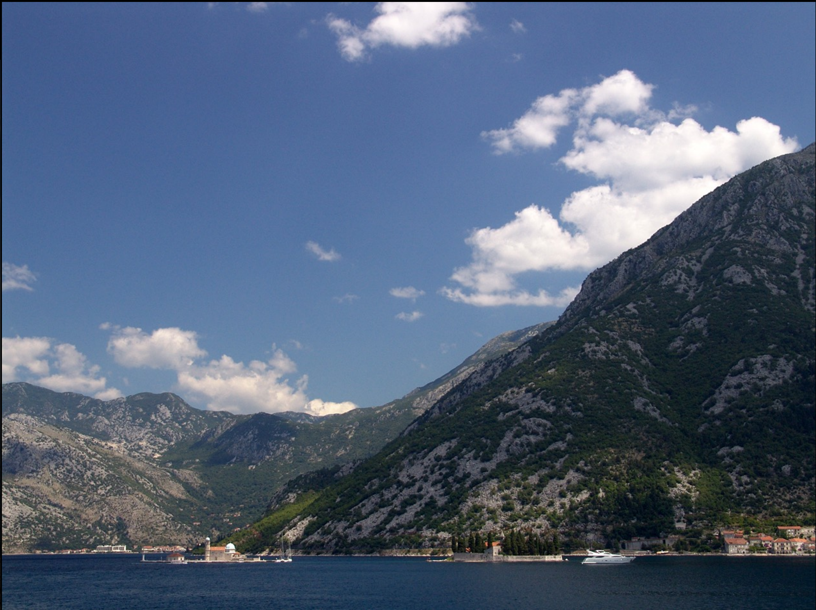
Golf von Kotor