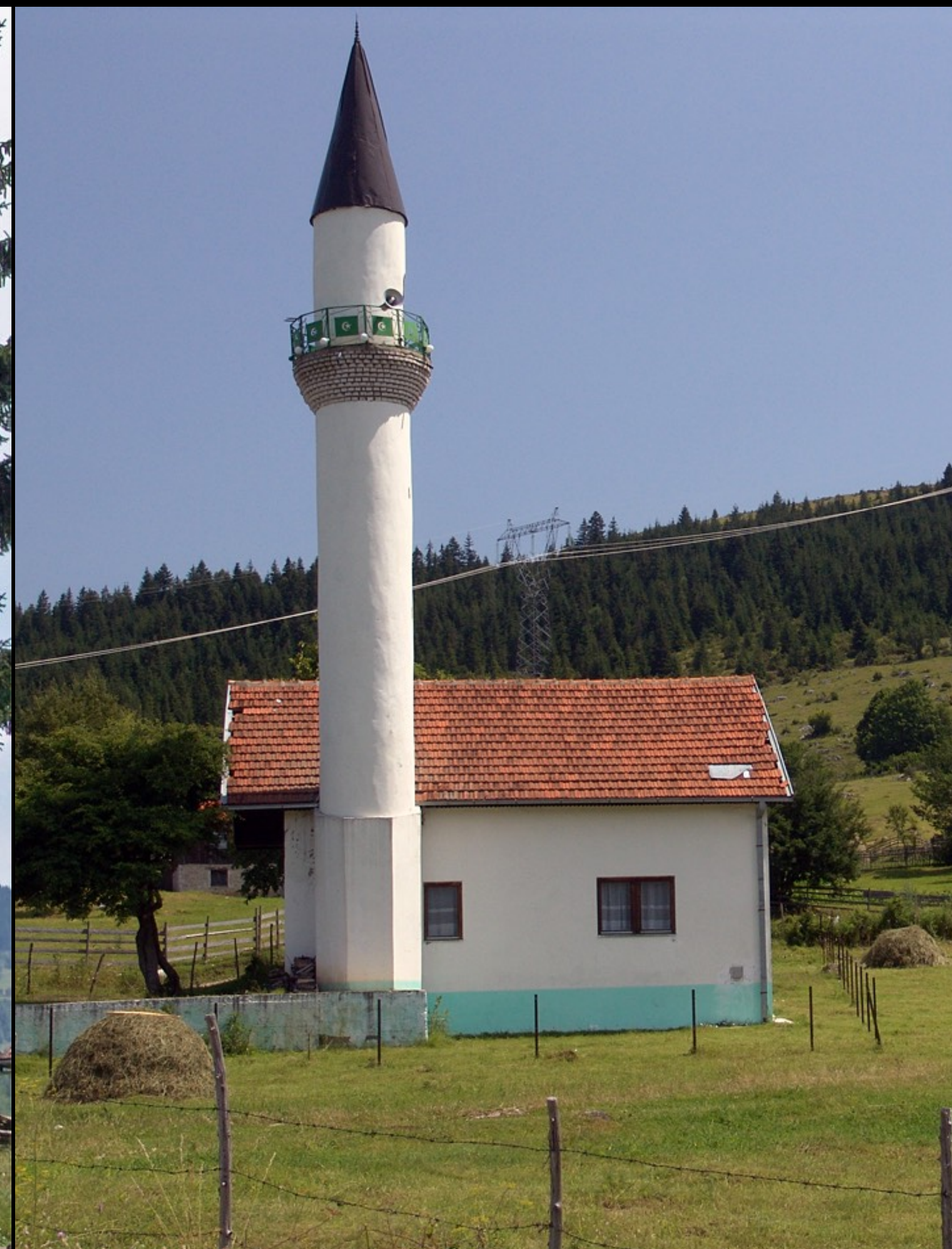
bei Rozaje, Ost-MNE