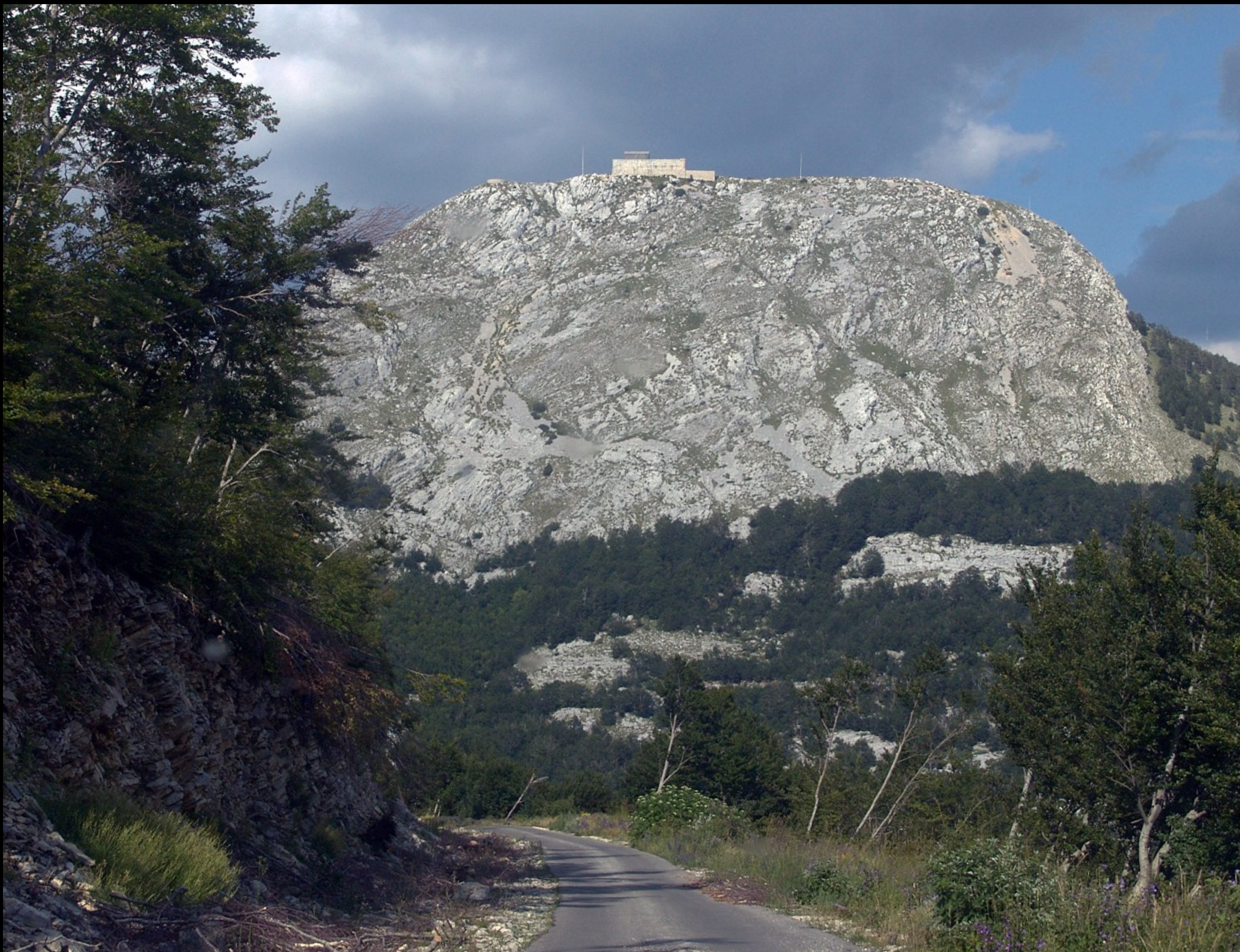
Jezerski Vrh, 1750m, mit Njegoš-Gedenkstätte