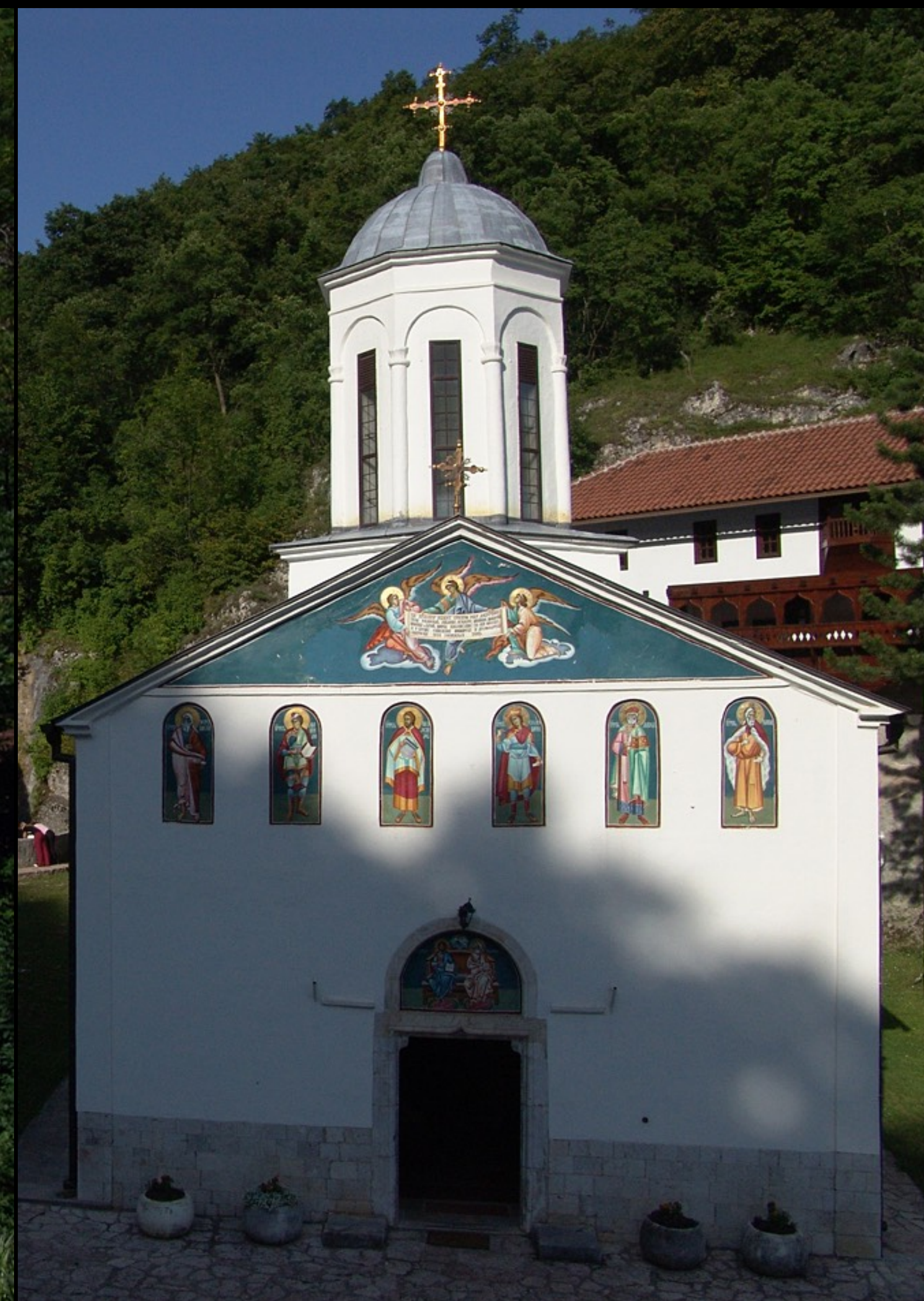
Sveti Trojce / Hlg. Dreifaltigkeit, Pljevlja, Nord-MNE, 16. Jh.