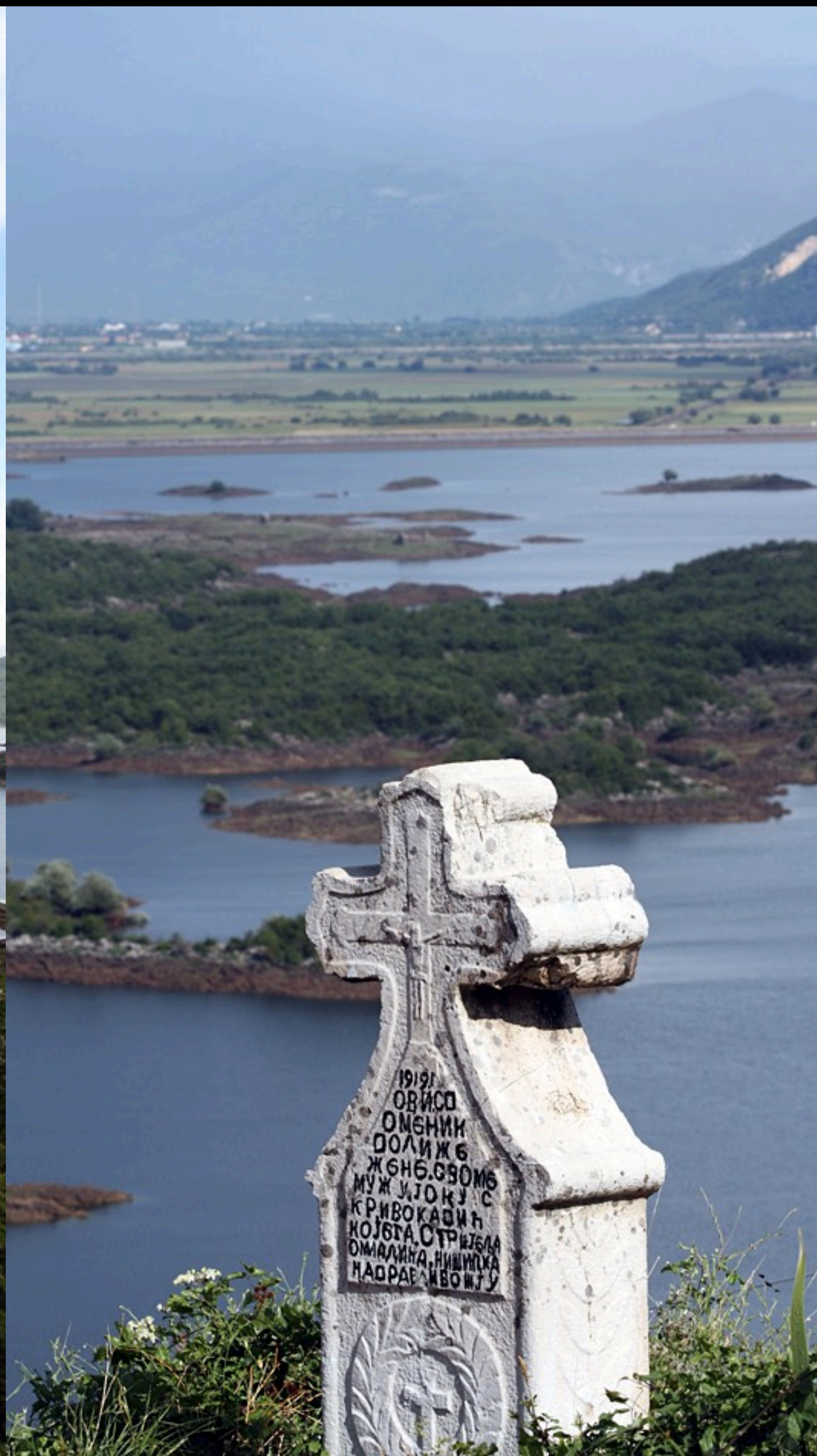
Slansko Jezero bei Nikšić