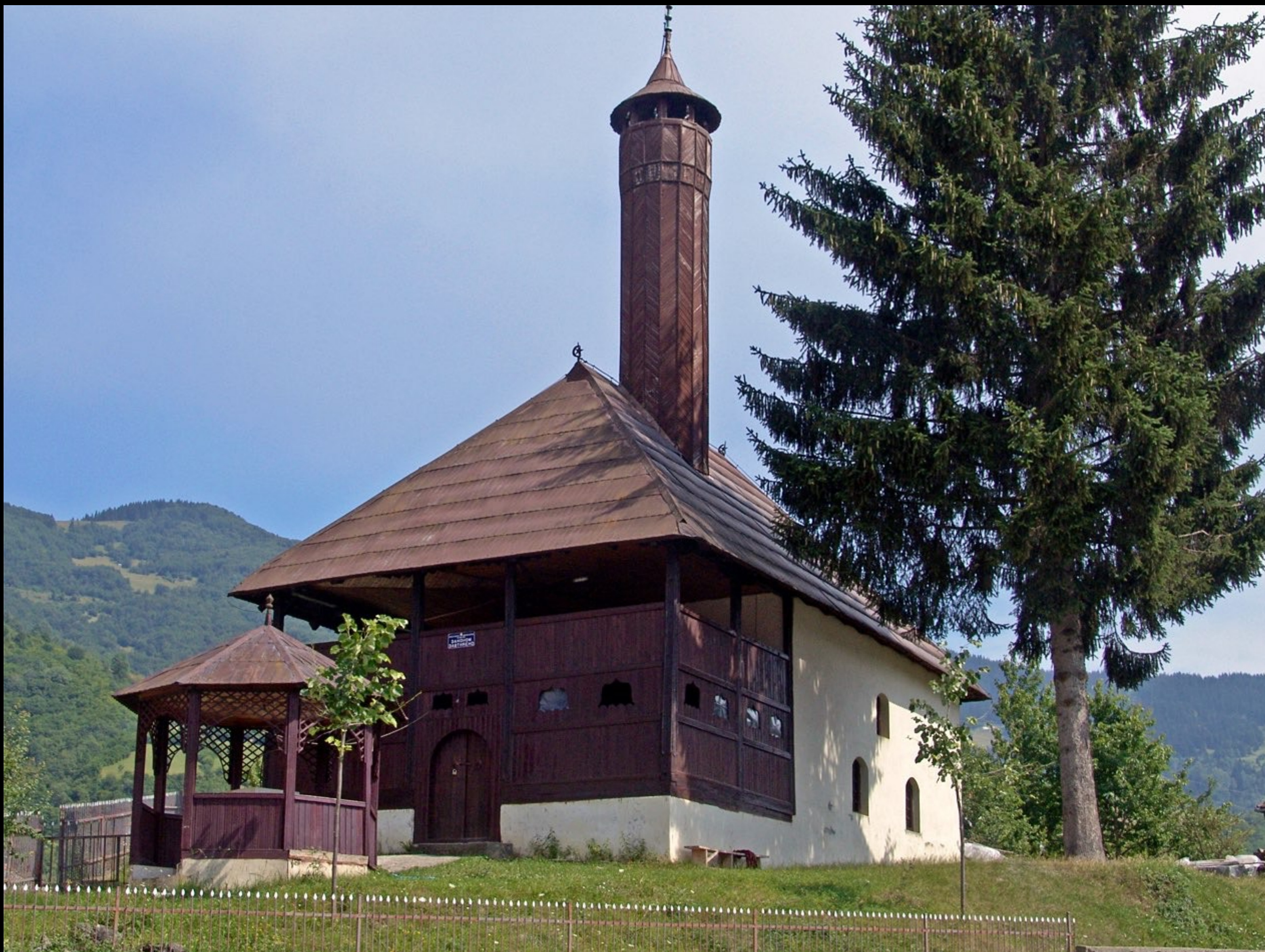
Plav, Carska Džamija (Kaisermoschee), die älteste Moschee in Montenegro (1471)