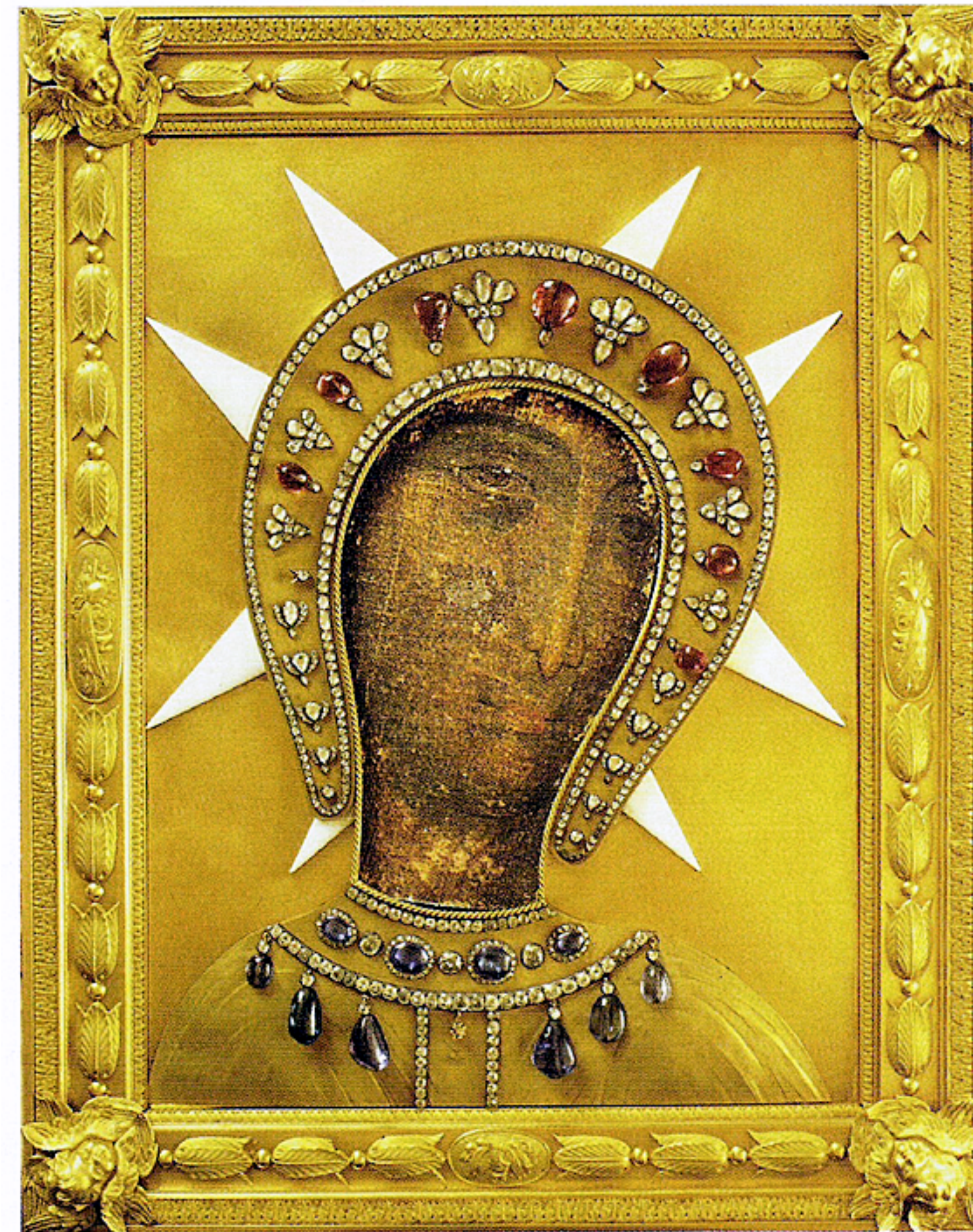
Madonna vom Berg Philerimos (Rhodos), Leinwandbild aus dem 16. Jh., Abdeckung (sog. Riza) und Rahmen um 1800, 50x40cm, Inv. 3024, Nationalmuseum, Cetinje