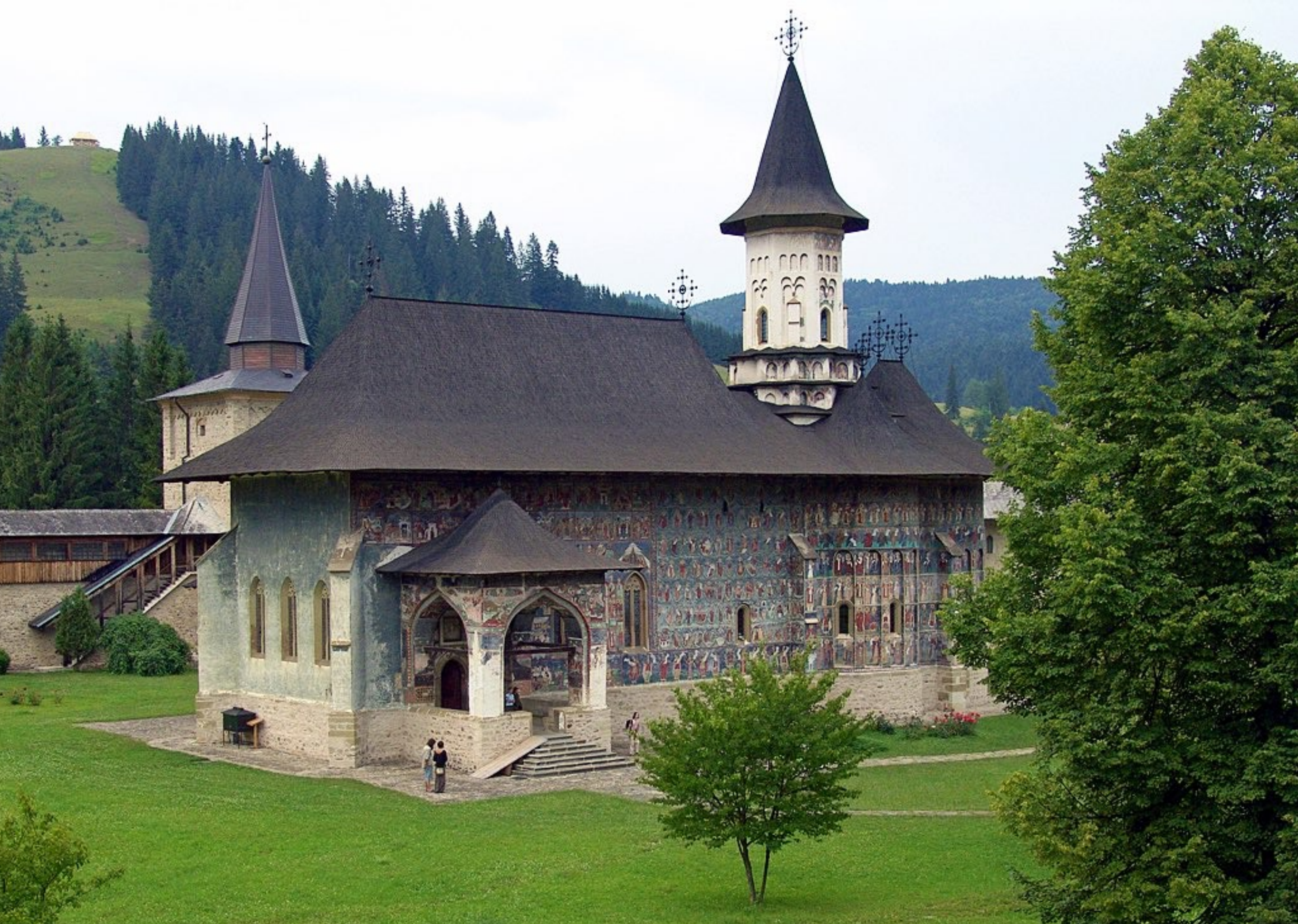
Wehrkloster Sucevița, Nordrumänien, 1600