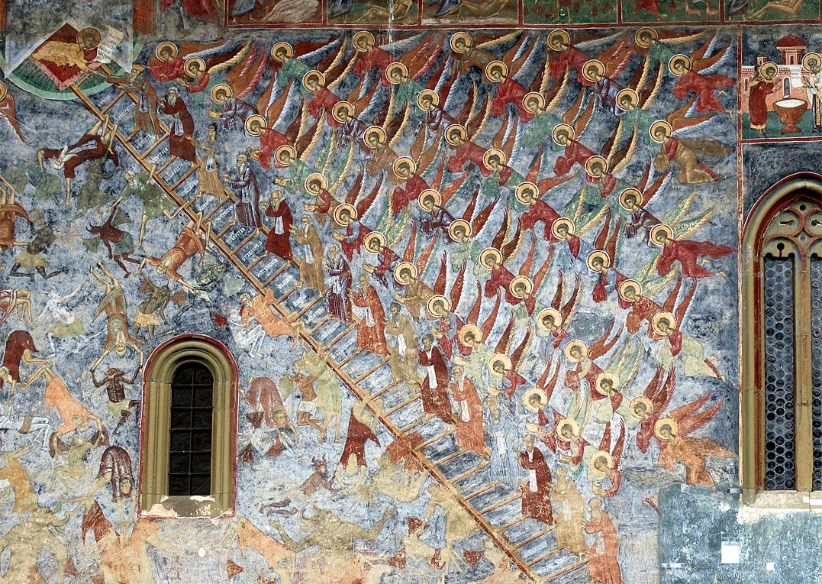
Nordfassade, Himmelsleiter mit stürzenden Dämonen und Menschen