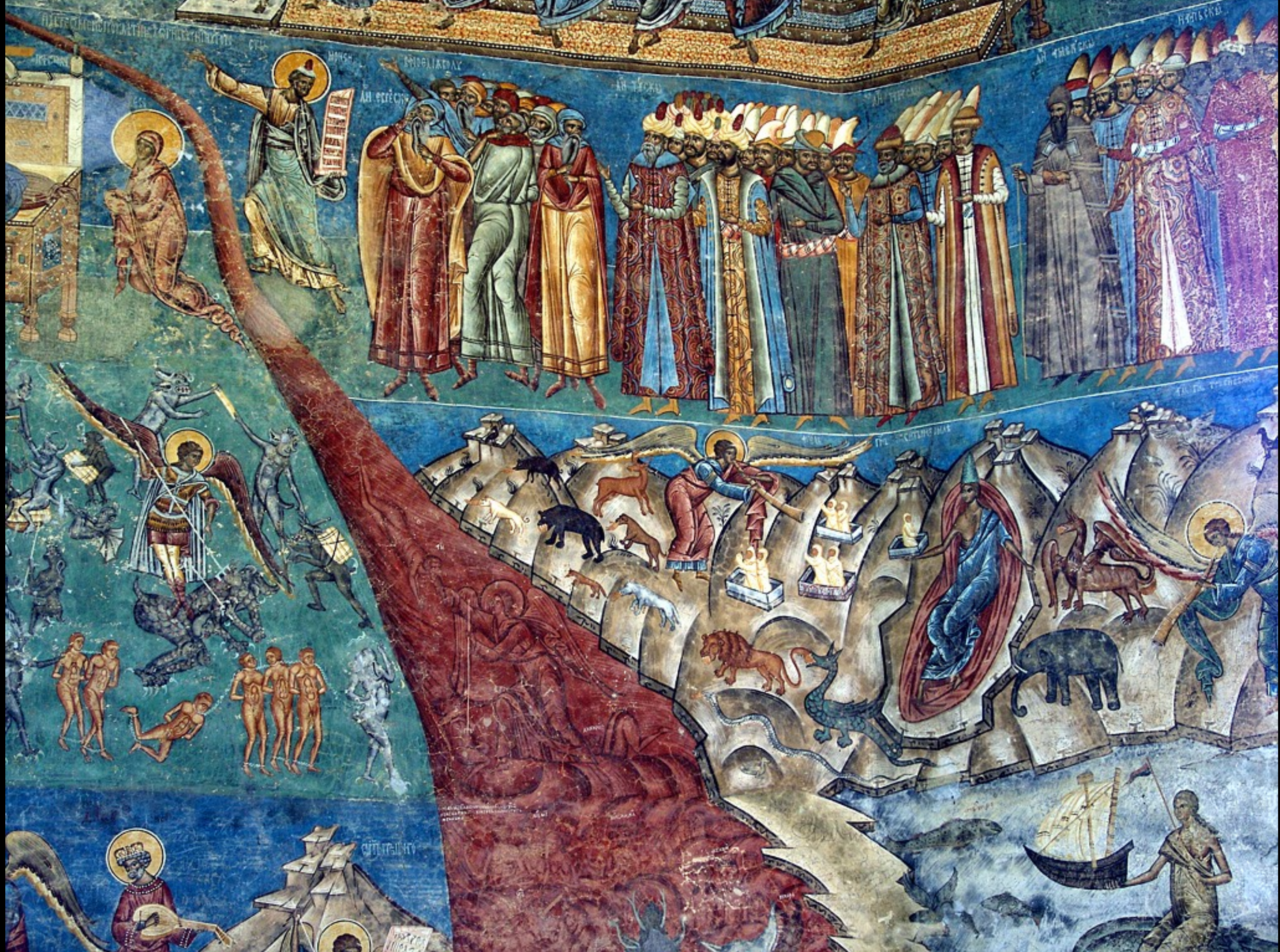
Westfassade, Gericht, die Verdammten