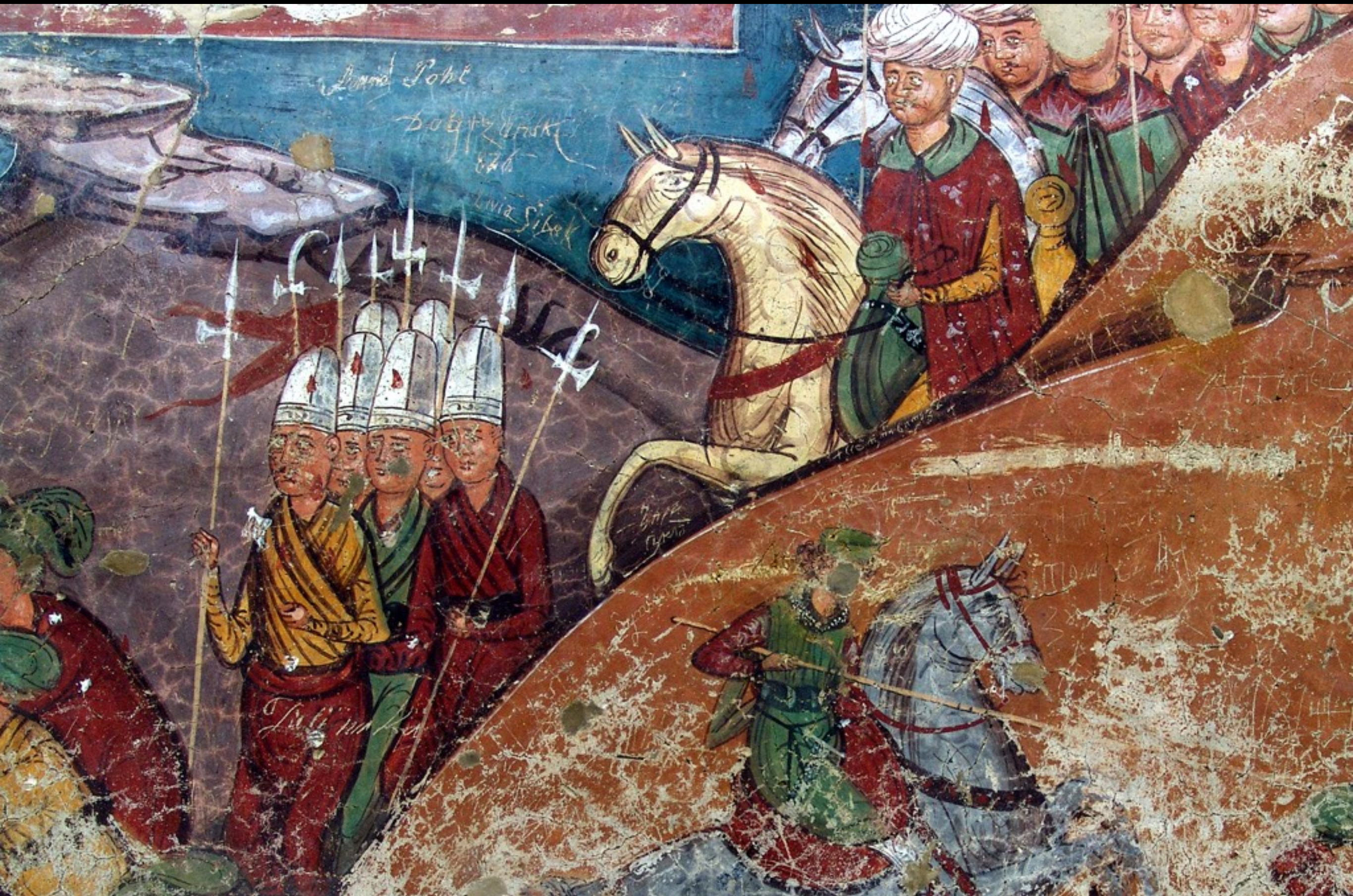
Südfassade, die Osmanen im Anmarsch auf Konstantinopel