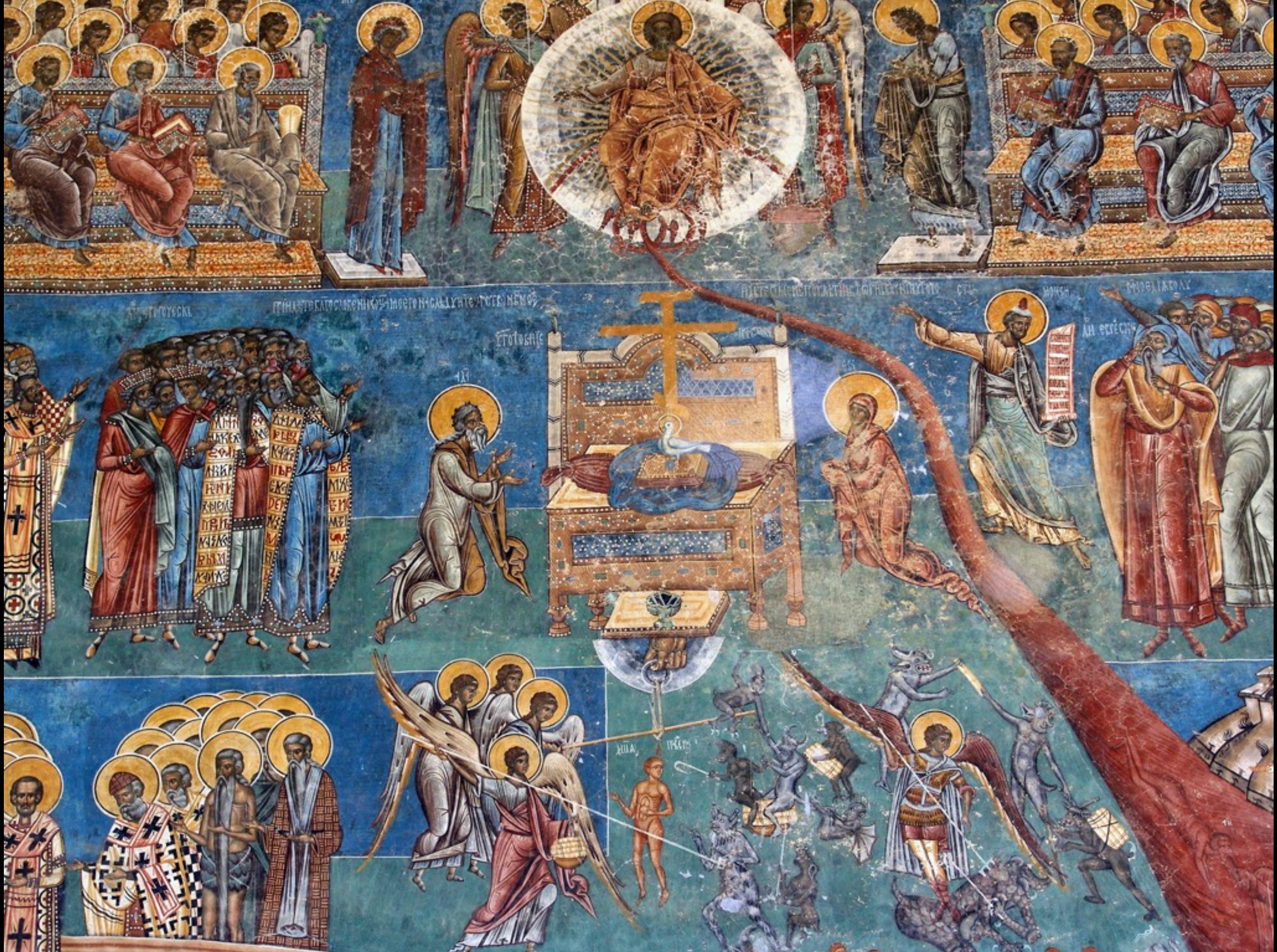
Westfassade, Gericht mit Seelenwägung (unten)