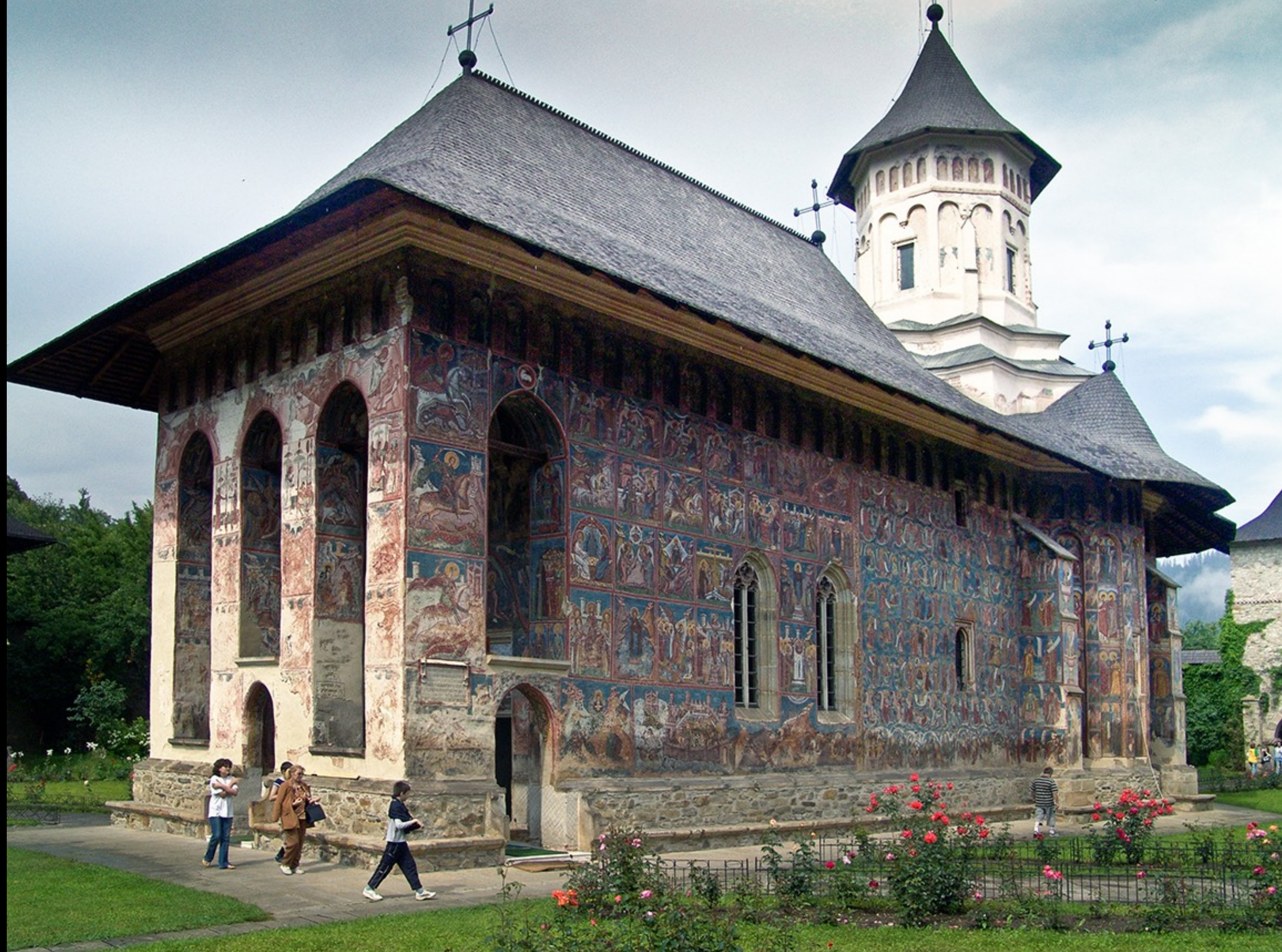
Moldovița, rumänisch-orthodoxes Frauenkloster (1532), Südfassade, Fresken 1537 ff.