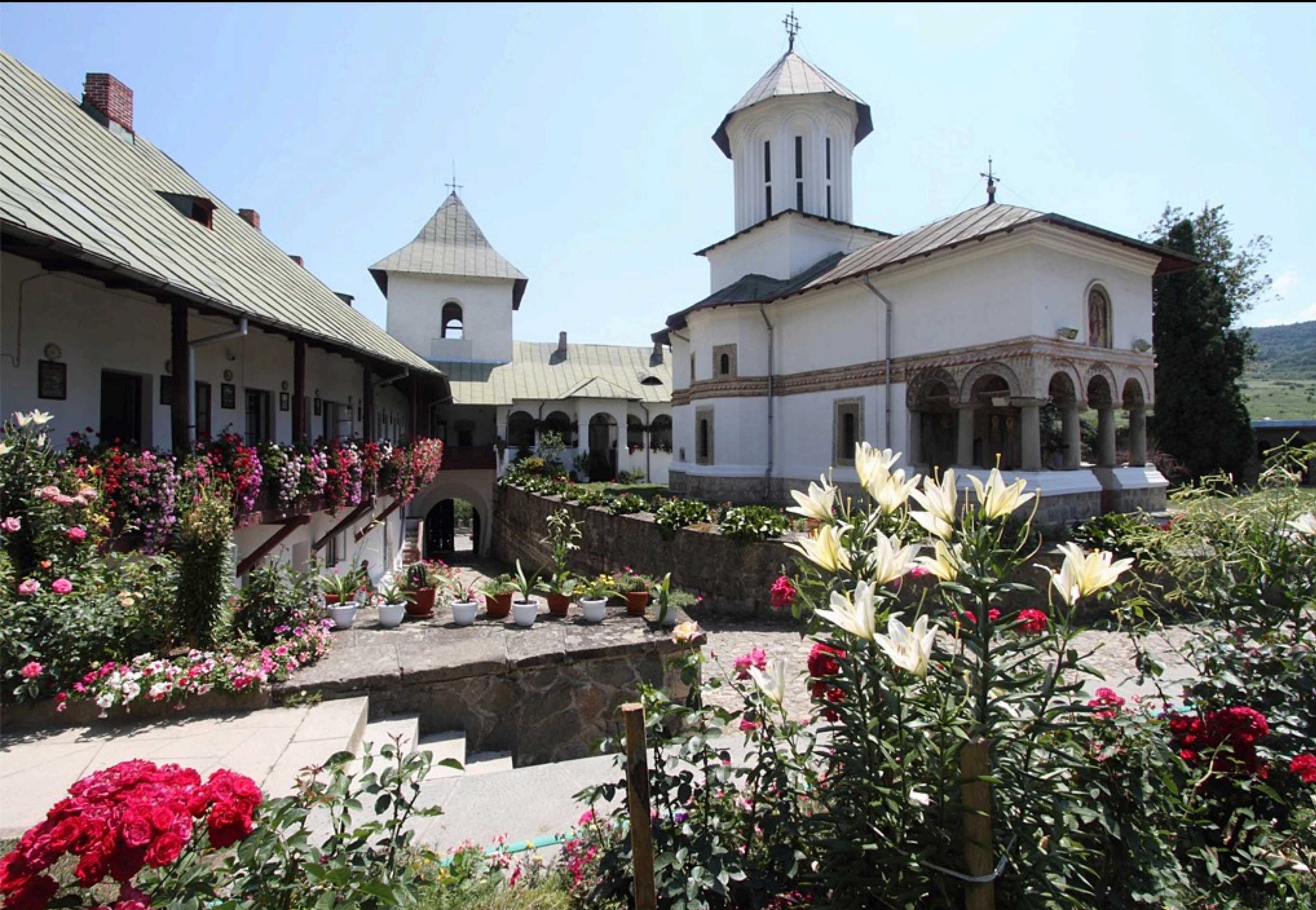
Kloster Gorova, Walachei (südlich der Karpaten)