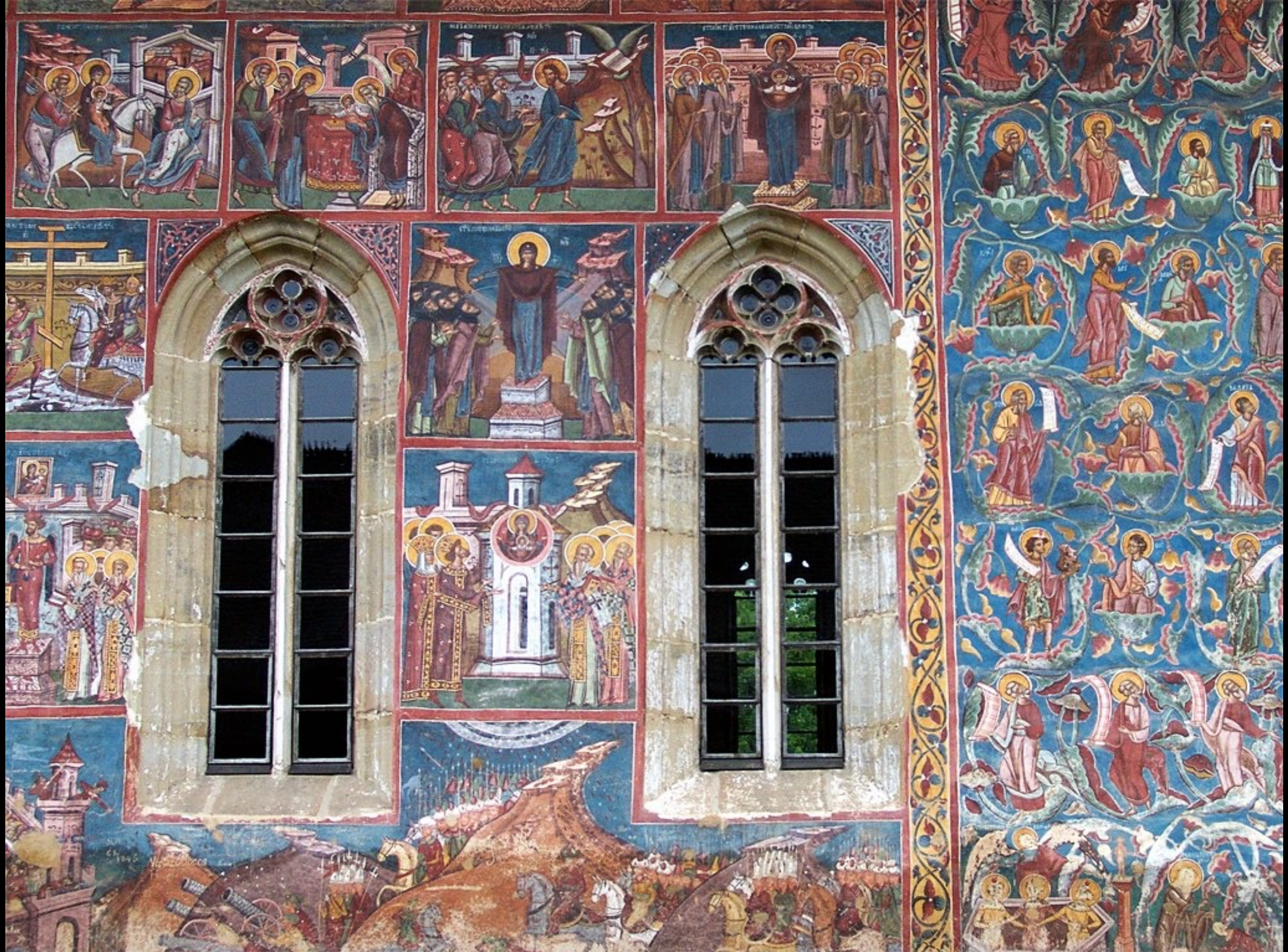
Südfassade, die Osmanen im Anmarsch auf Konstantinopel