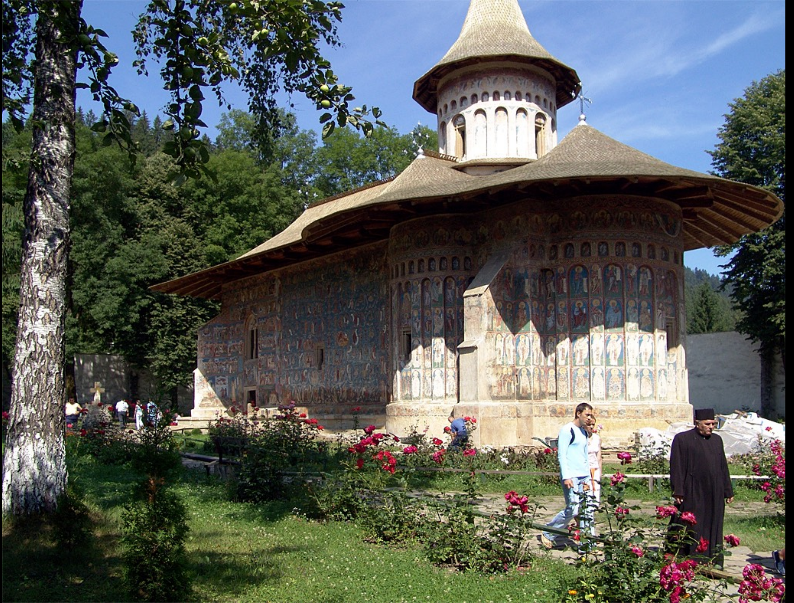
Klosterkirche des Hlg. Georg, Voronet (1488)