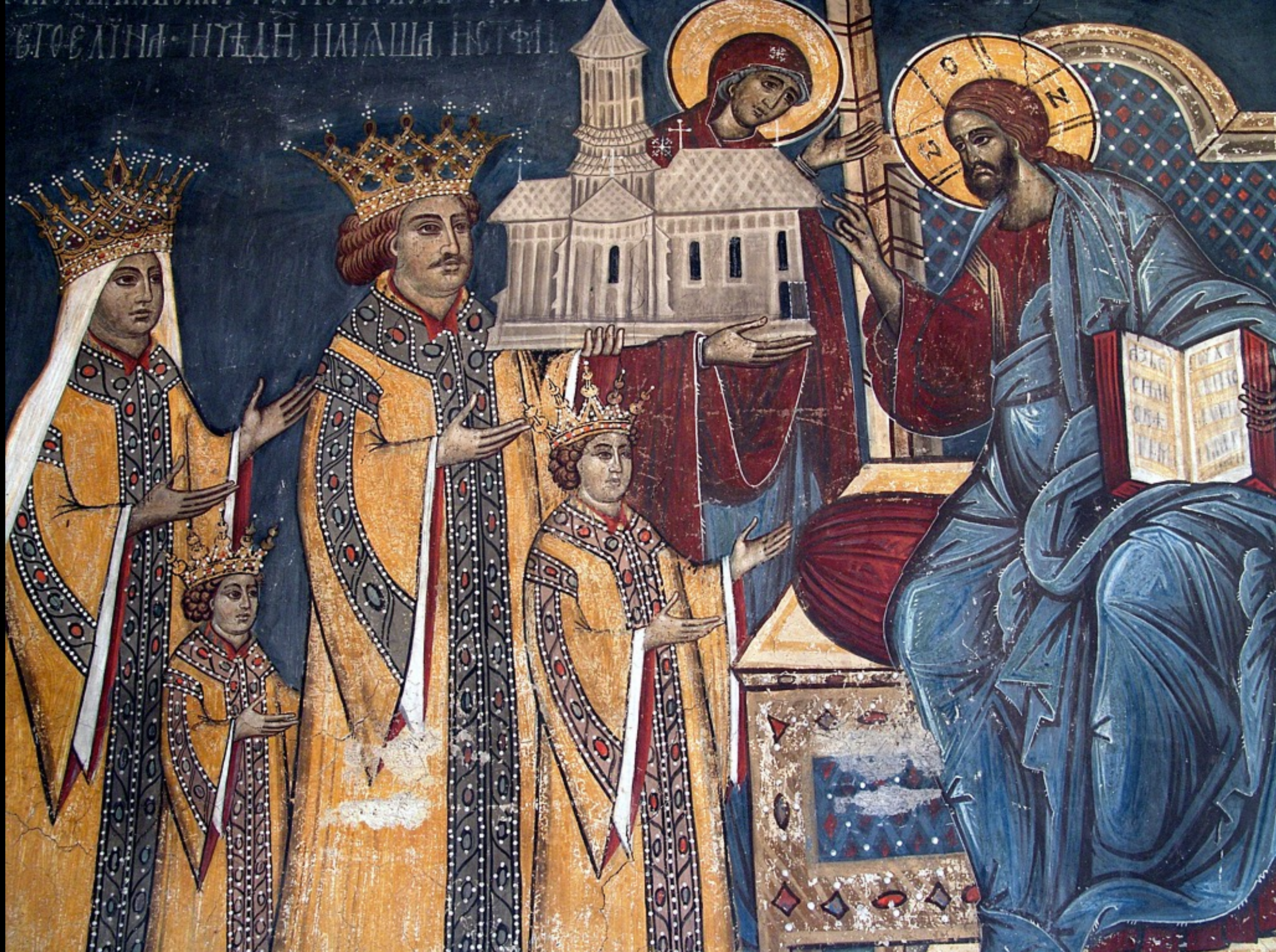
Moldovița, Stiftung des Klosters durch Petru Rareș, Woivode des Fürstentums Moldau