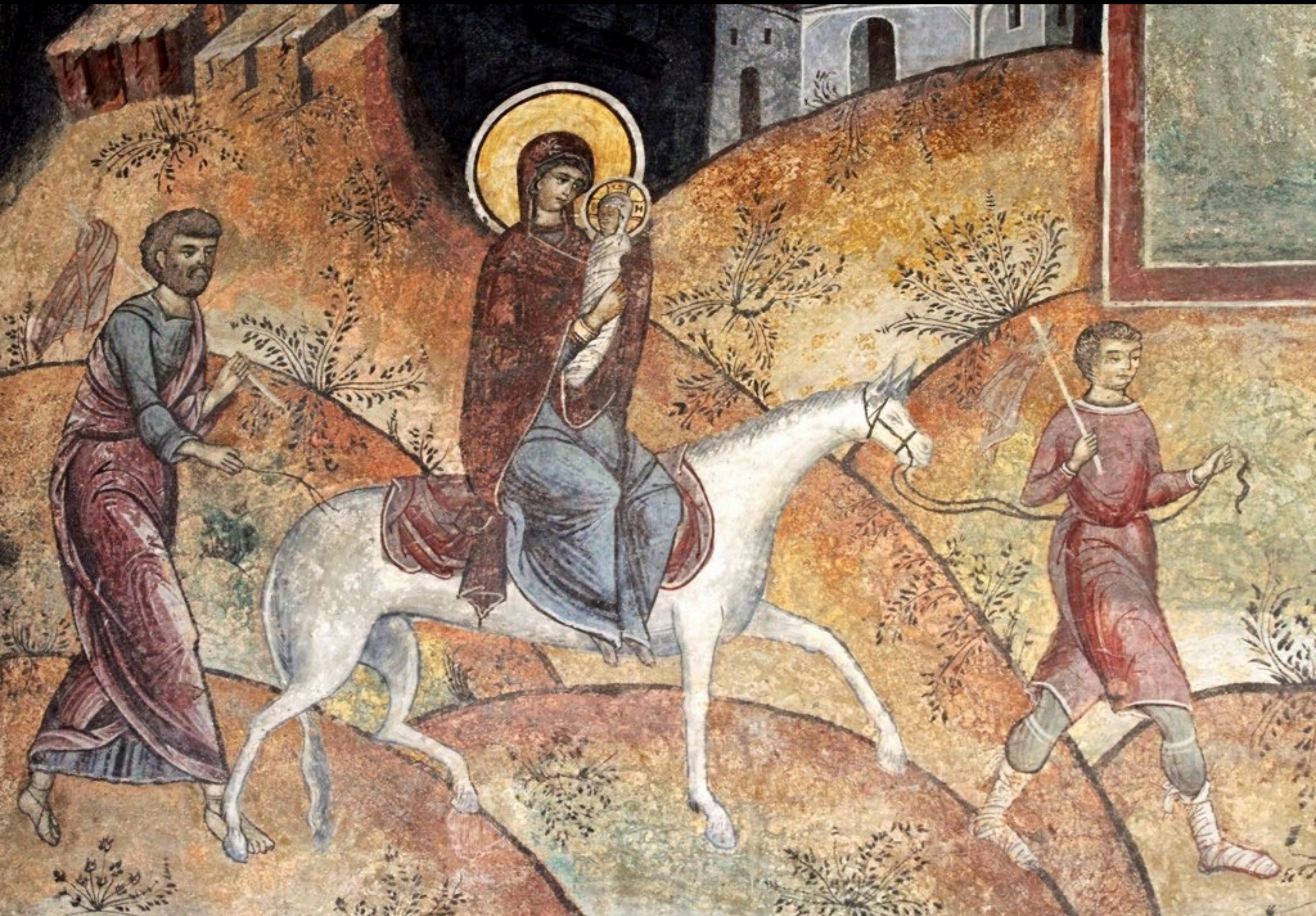
Die Flucht der Heiligen Familie nach Ägypten