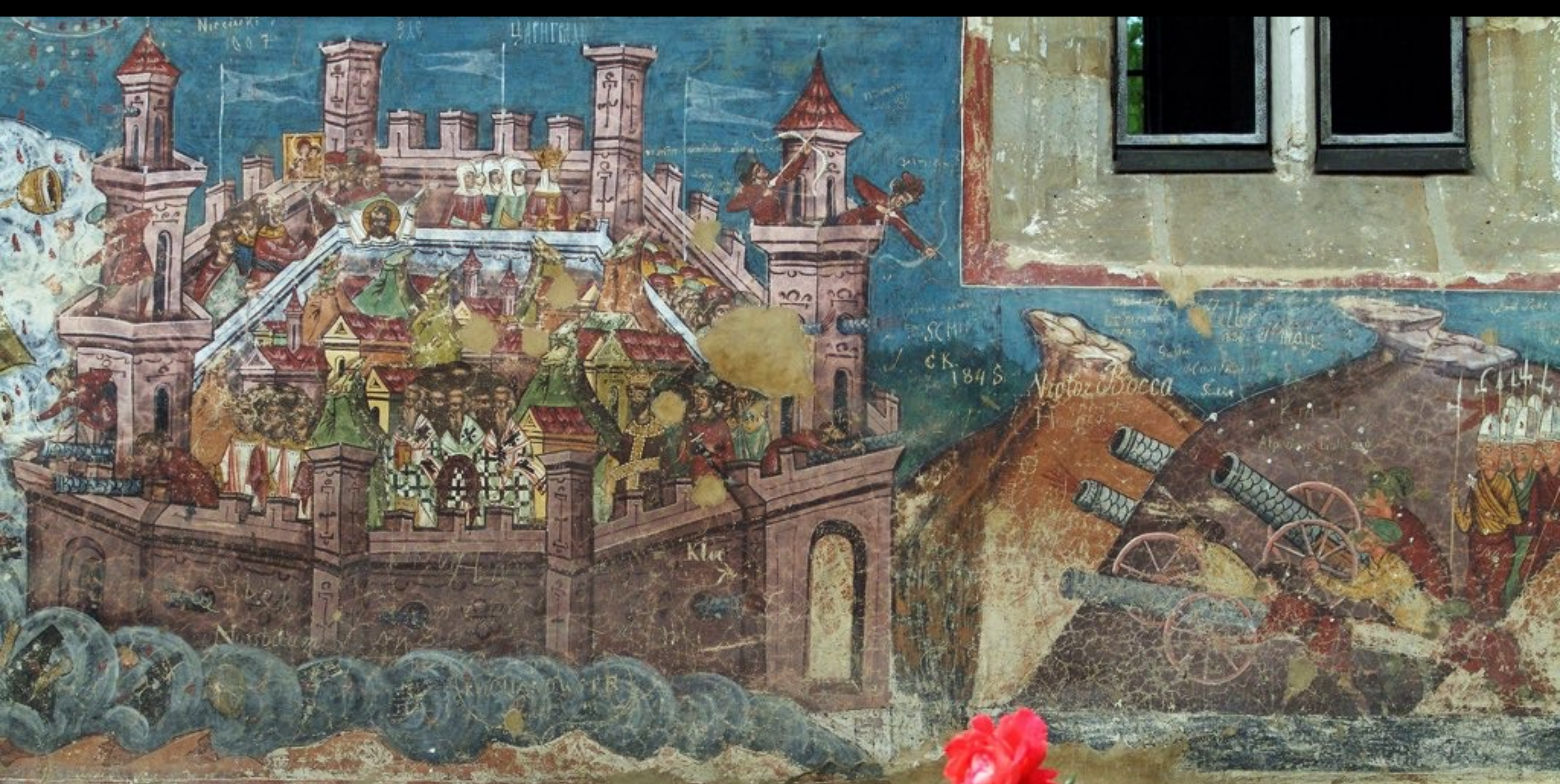
Belagerung von Konstantinopel 1453