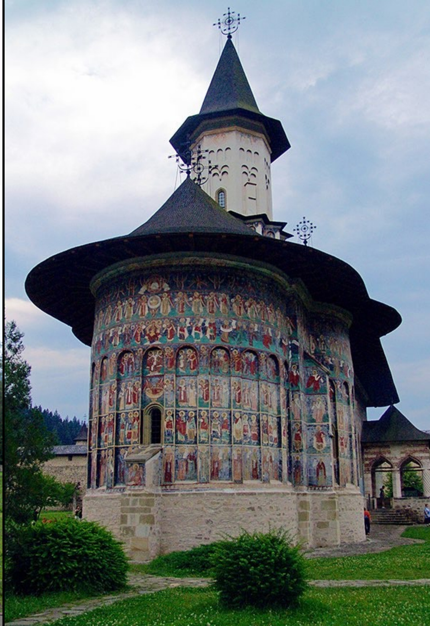
Wehrkloster Sucevița, Nordrumänien, 1600