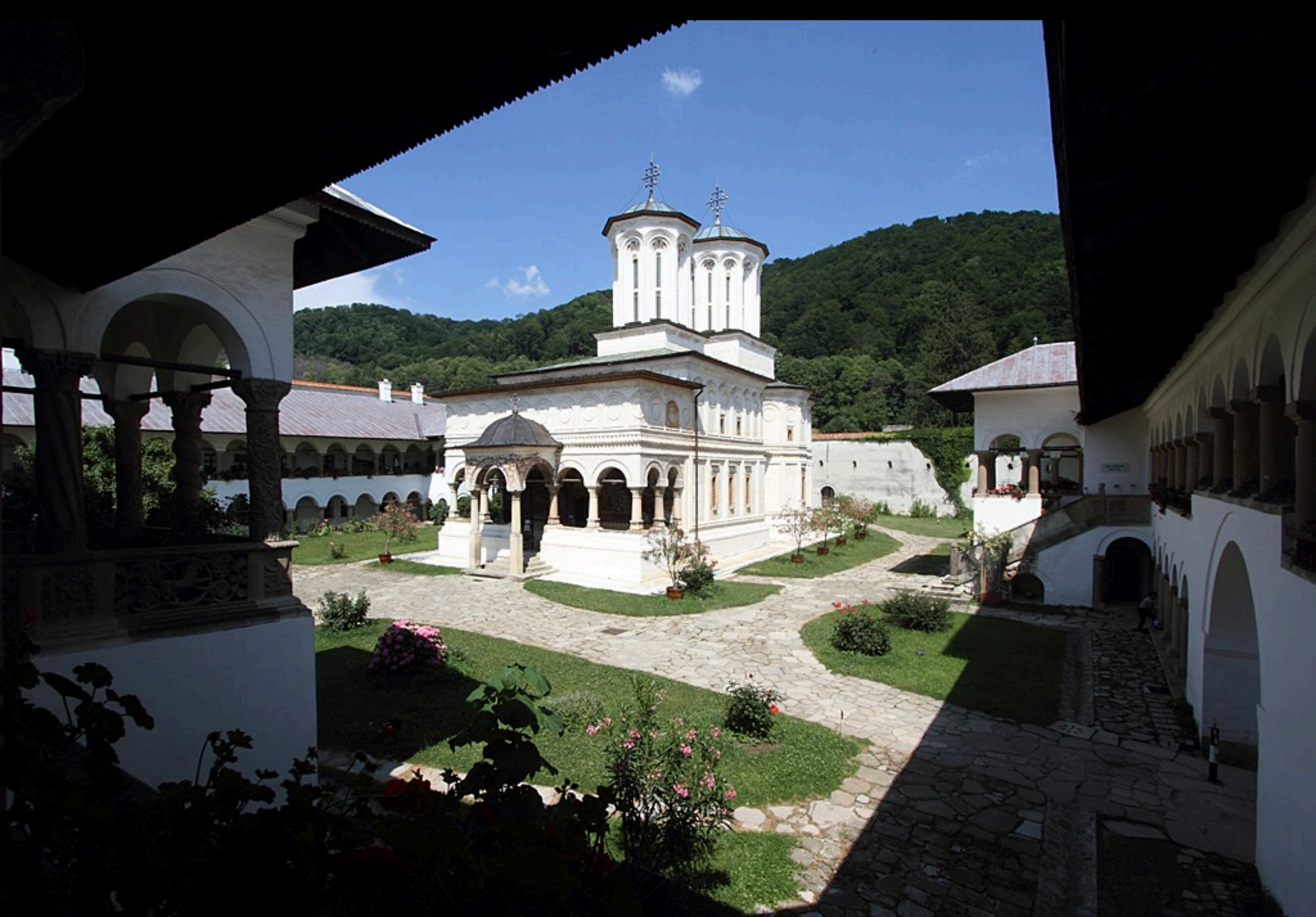
Kloster Horezu, Süd-Karpaten